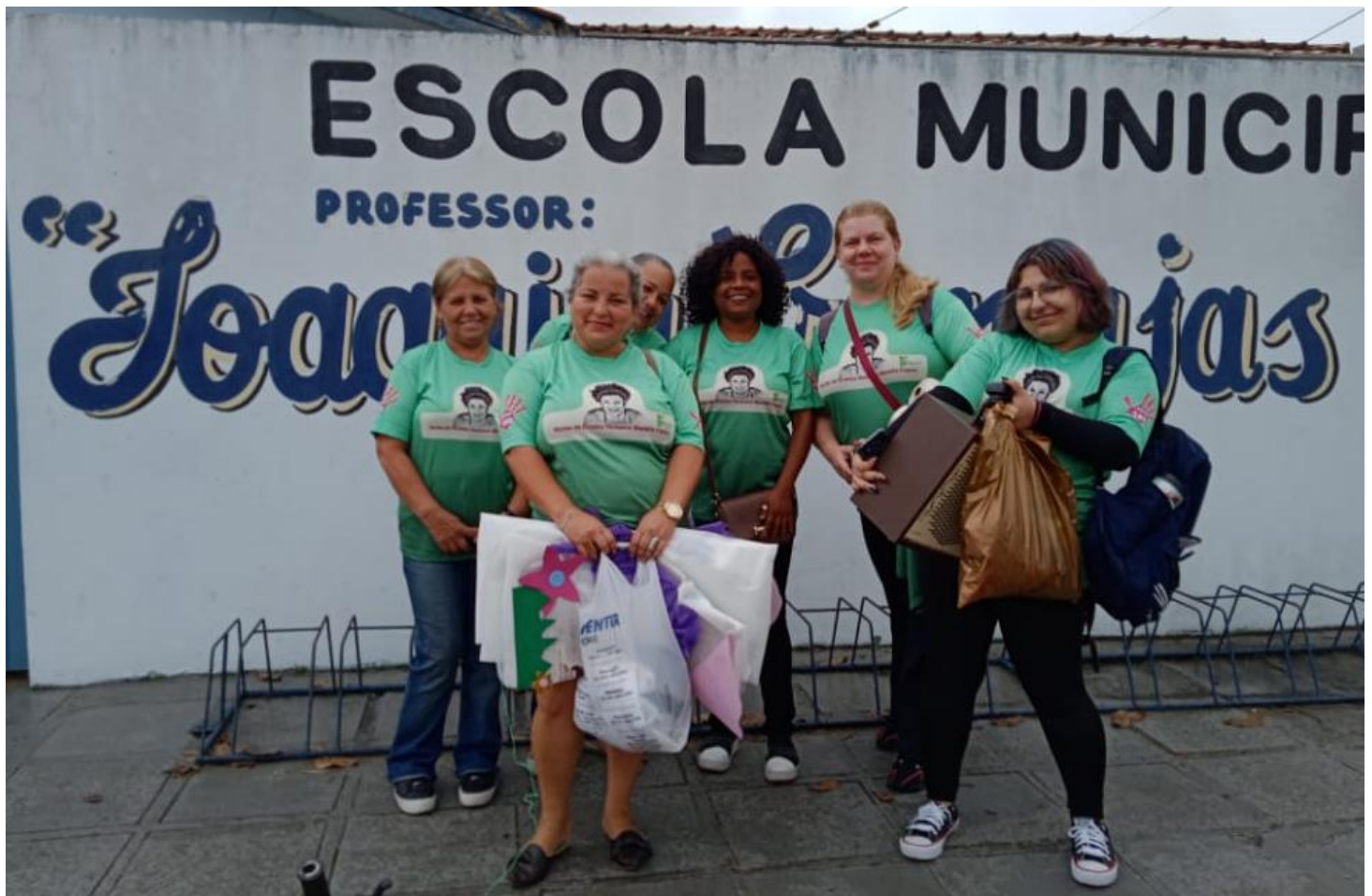
Coordenadora do projeto, aluna bolsista e defensoras populares em um registro após realizar o teatro de fantoches focada na temática da violência doméstica em uma escola da rede municipal de Paranaguá.

Instituto Federal de Educação, Ciência e Tecnologia do Paraná - Campus Paranaguá ORCID ID 0000-0003-0347-0668