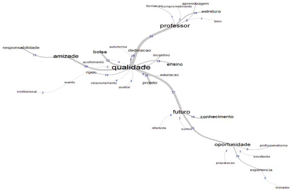
Figura 5: Árvore Máxima.

Revista eletrônica de investigação filosófica, científica e tecnológica