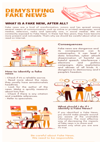
Imagem 2: Infográfico produzido pelos alunos