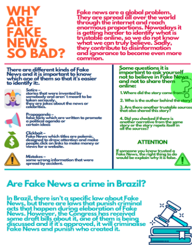
Imagem 1: Infográfico produzido pelos alunos

Pelo apresentado acima, reitera-se o refletido a priori : garantir voz e dar ouvido aos estudantes é uma possibilidade autonomia a esses, afinal, tornam-se protagonistas no processo de ensino aprendizagem. Na mesma esteira, a preocupação dos alunos quanto a alertar as pessoas sobre as notícias falsas fez com que fosse proposta uma campanha de conscientização sobre a propagação destas notícias. Como atividade final, a proposta foi que os estudantes criassem um material (cartaz, vídeo, infográfico...) em língua portuguesa e em língua inglesa que versasse sobre a temática.