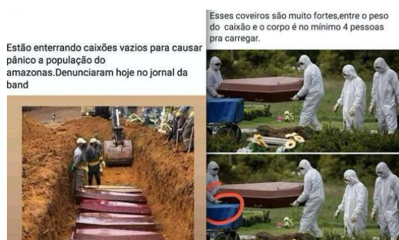
Imagem 3: Fake News sobre enterro de caixões vazios

O segundo encaminhamento da atividade integradora consistiu em contextualizar os estudantes sobre o perigo das notícias falsas, assim como sobre a velocidade com que essas propagam-se pelo mundo. Para tanto, houve a seleção de uma Fake News propagada em massa no Brasil sobre o enterro de caixões vazios de “supostas vítimas” da Covid-19, em Manaus, Amazonas. Na intenção de enfatizar a relevância de se dedicar à verificação das fontes das notícias, foram disponibilizadas aos estudantes imagens de manchetes de diferentes meios de comunicação brasileiros, dentre os quais a G1, Uol, BBC Brasil, Folha de São Paulo, evidenciando que as notícias propagadas no relativo à abertura dos caixões são falsas, de modo que fosse, também, trazido à tona um vídeo, publicado pela Rede Record, que demonstra o relato da criadora da notícia falsa, que foi judicialmente indiciada.