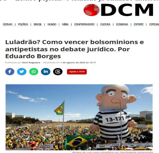
Figura 5 – Léxico pejorativo luladrão já utilizado anteriormente.