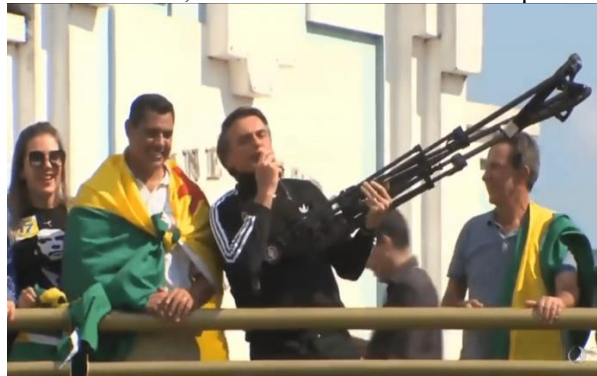
Figura 1 – “Em 2018, Bolsonaro defendeu ‘fuzilar a petralhada’”.

Outro termo frequentemente utilizado durante esse período foi petralha , que combina o radical /PT/, aludindo ao Partido dos Trabalhadores, com o sufixo pejorativo /-ralha/, que remete à rale, grupo social marginalizado. Esse neologismo reflete uma tentativa de desumanizar os membros e apoiadores do PT, associando-os a um grupo de menor valor ou importância. Em 2018, o uso de petralha foi intensificado como parte da retórica anti-PT que dominava os discursos de campanha e as redes sociais, no qual o PT foi frequentemente associado à corrupção e à degeneração moral. A reportagem da revista Veja aborda a declaração polêmica do ex-presidente JMB, em 2018, quando ele sugeriu “fuzilar a petralhada”, gerando ampla repercussão e críticas, consoante figura 1.