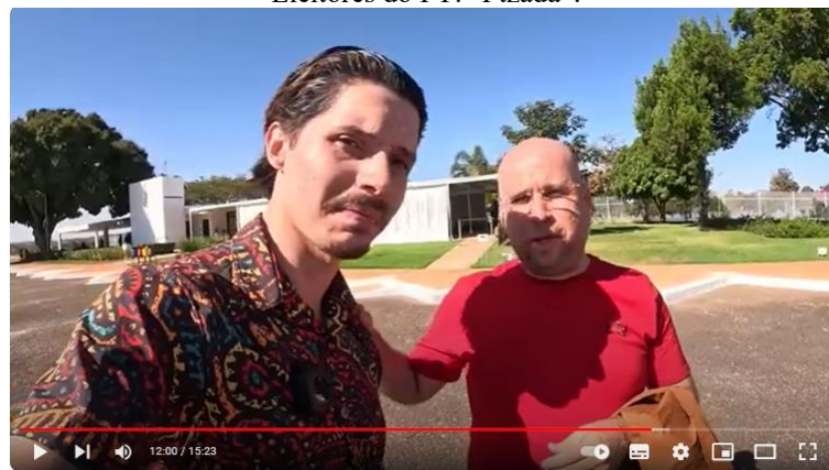
Figura 4 – Críticas Polêmicas e Confrontos nas Redes: A Retórica Provocativa de Wilker Leão Contra Eleitores do PT: “Ptzada”.

Lula corta o Bolsa Família de milhões de famílias, mas pra PTzada tá tudo bem - Ep. 74 nas ruas