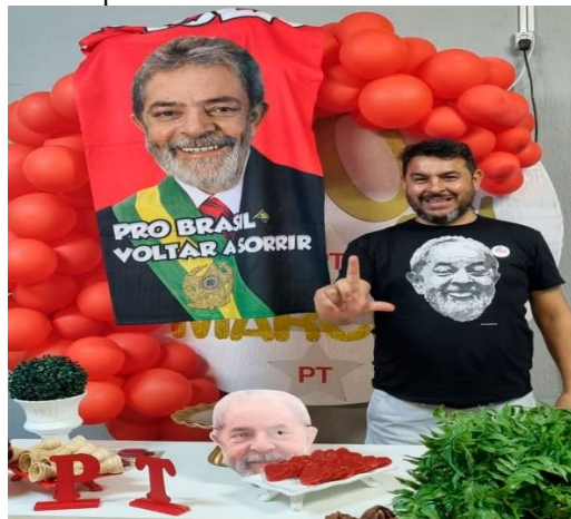
Figura 3 – “Lulista morre após troca de tiros com bolsonarista em Foz do Iguaçu (PR).”

De modo suplementar, integrando-se com eficácia ao conjunto, Lulista segue uma lógica semelhante, sendo um neologismo que utiliza como o radical /Lul/, derivado do nome próprio Lula, que se trata do atual presidente da república federativa do Brasil, hoje em seu terceiro mandato (2023-2026), com o sufixo /-ista/, que indica seguidor. Durante a campanha de 2018, a imagem de Lula foi central tanto para os defensores quanto para os detratores da esquerda. Embora estivesse preso durante grande parte da campanha, Lula permaneceu uma figura central, e o termo lulista foi usado tanto como emblema de orgulho quanto como rótulo pejorativo. A redação do site Consultor Jurídico utiliza o termo lulista para se referir a um eleitor do atual presidente Lula, que foi assassinado durante sua festa de aniversário, cujo tema era dedicado ao referido chefe de Estado, conforme visto na figura 3.