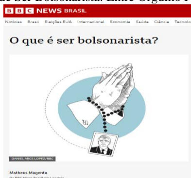
Figura 7 – O Significado de Ser Bolsonarista: Entre Orgulho Político e Insulto Ideológico.

Revista eletrônica de investigação filosófica, científica e tecnológica.