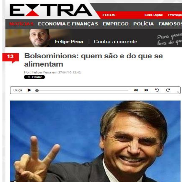
Figura 6 – “Bolsominions: quem são e do que se alimentam”.

Revista eletrônica de investigação filosófica, científica e tecnológica.