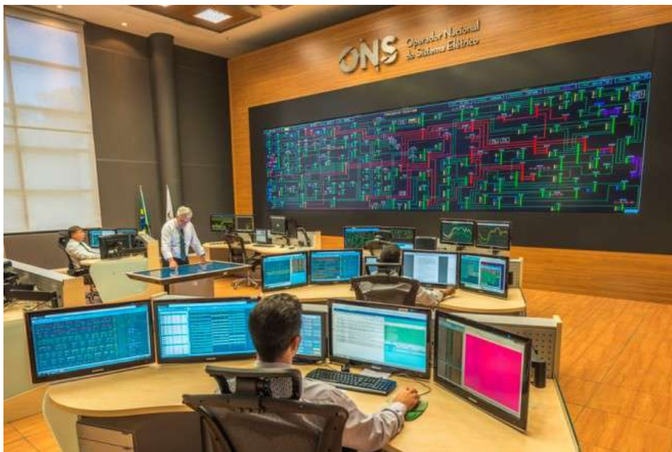
Figura 4: Centro Regional de Operação Sul Florianópolis.

Revista eletrônica de investigação filosófica, científica e tecnológica