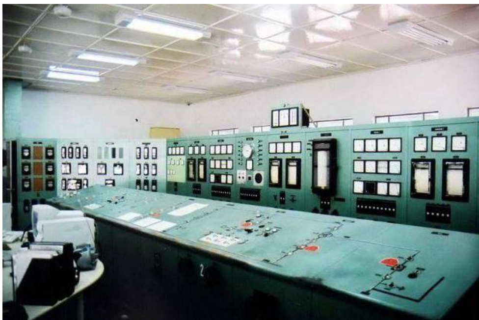
Figura 3: Antiga sala de controle (Canastra, RS).

Revista eletrônica de investigação filosófica, científica e tecnológica