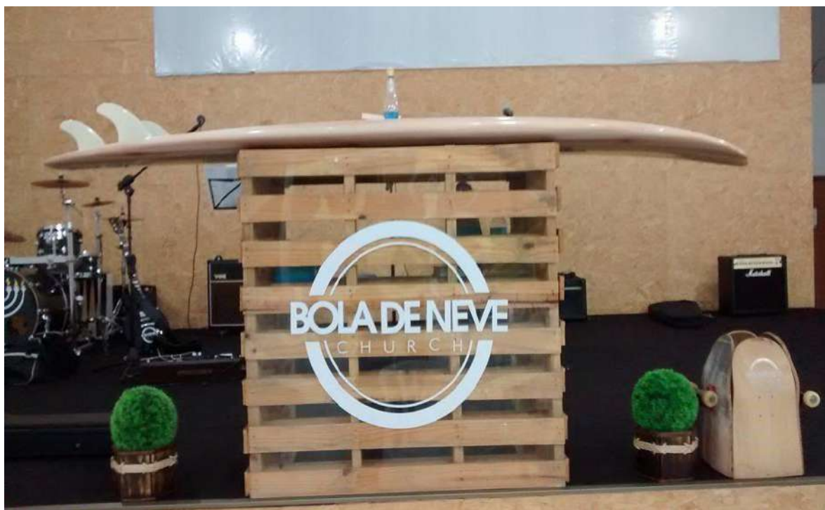
ANEXO 01 - Púlpito da Igreja Evangélica Bola de Neve de Toledo-PR.