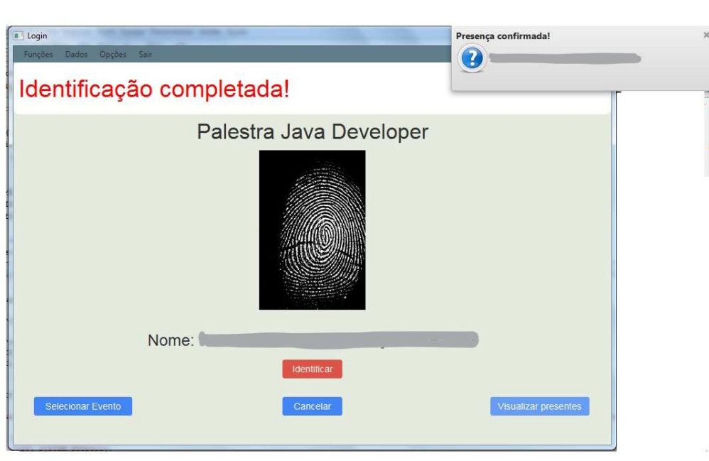
Figura 1 – Tela de identificação da digital - Módulo desktop