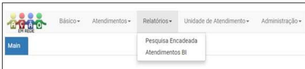
Figura 3: Destaque à aba “Relatórios”, e às opções de “Pesquisa encadeada” e “Relatórios de BI”

Ao organizar toda a oferta dos serviços em um único instrumento de monitoramento, espera-se que ocorra celeridade entre os encaminhamentos, circulação de informações e construção de conhecimentos a respeito dos sujeitos atendidos.