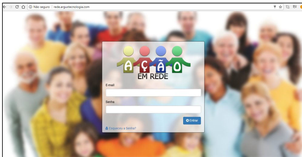
Figura 1: Tela inicial do sistema

O conhecimento sobre a rede e sobre os serviços que a compõem é um dos aspectos essenciais do portal. Ao dar visibilidade aos serviços, identificando-se o que fazem, a que atendem, quais ações realiza, quem são os profissionais que nele atuam, o processo de difusão do conhecimento ocorre ao mesmo tempo em que se geram as informações. Aparentemente simples, a ausência de informações sobre os serviços que compõem determinada rede é uma das fragilidades identificadas no trabalho social. Ao conhecer os serviços, os profissionais podem acessar aqueles que, em dado momento, mais contribuirão para potencializar o trabalho realizado com determinada família, bem como solicitar as informações que dado serviço já obteve, sem ter que submeter as famílias aos mesmos questionários a cada novo atendimento realizado.