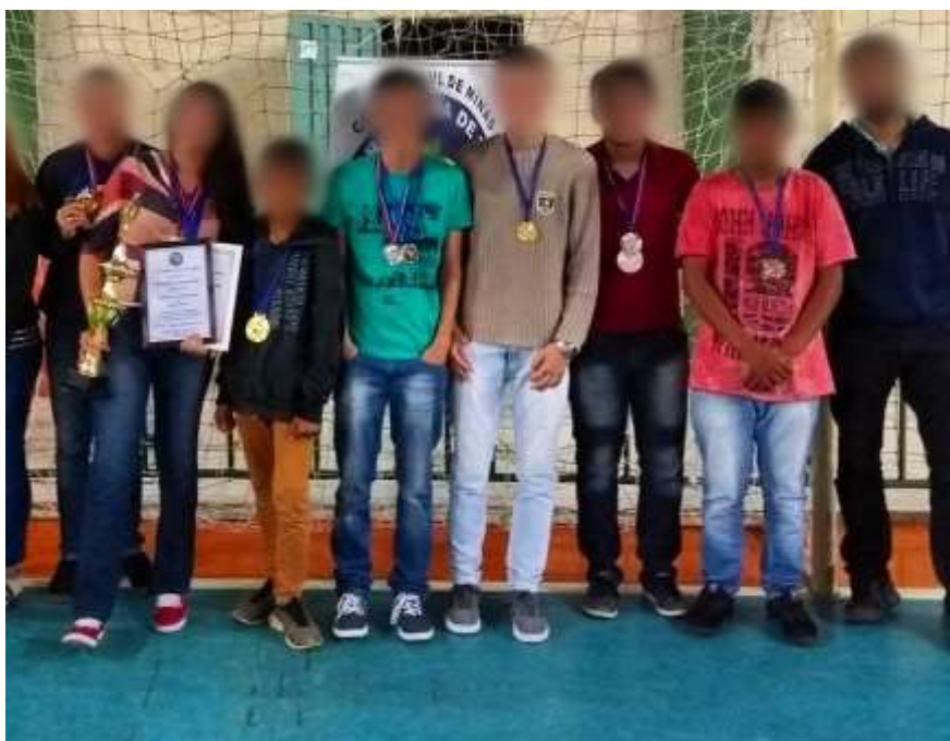
Figura 5: Enxadristas premiados na Copa LBX Sul de Minas.