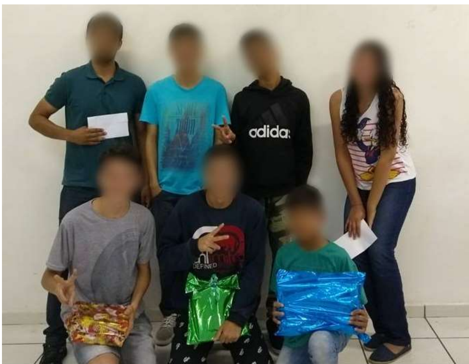
Figura 4: Premiação de um campeonato interno realizado durante o curso de xadrez.

Além disso, nas datas próximas aos campeonatos, o foco das aulas era o treino de táticas e, também, a realização de campeonatos internos, que permitissem o aperfeiçoamento dos jogadores e a preparação para as competições externas. A Figura 4 exibe os participantes durante a premiação após a realização de um campeonato interno.