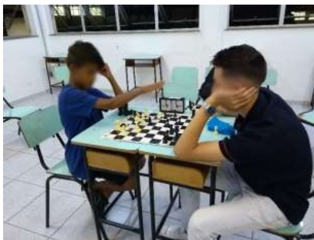
Figura 3: Participação de estudantes de diferentes níveis de ensino no curso de xadrez.

Em relação à interação dialógica, pode-se afirmar que o curso de xadrez promoveu o contato entre estudantes de diferentes níveis, incluindo aqueles matriculados no ensino fundamental e médio (Figura 3), além dos graduandos e pós-graduandos. Esse cenário favoreceu o diálogo entre os participantes e a troca de saberes, haja vista as diferentes experiências de vida e expectativas com a prática de xadrez. Isso porque, em alguns casos, um estudante de ensino fundamental prefere aprender o básico do jogo, podendo aplicar o xeque mate pastor nos colegas de escolas. Enquanto o estudante de graduação almeja participar de campeonatos universitários ou externos, tendo ambição por aprender táticas e finais de jogo.