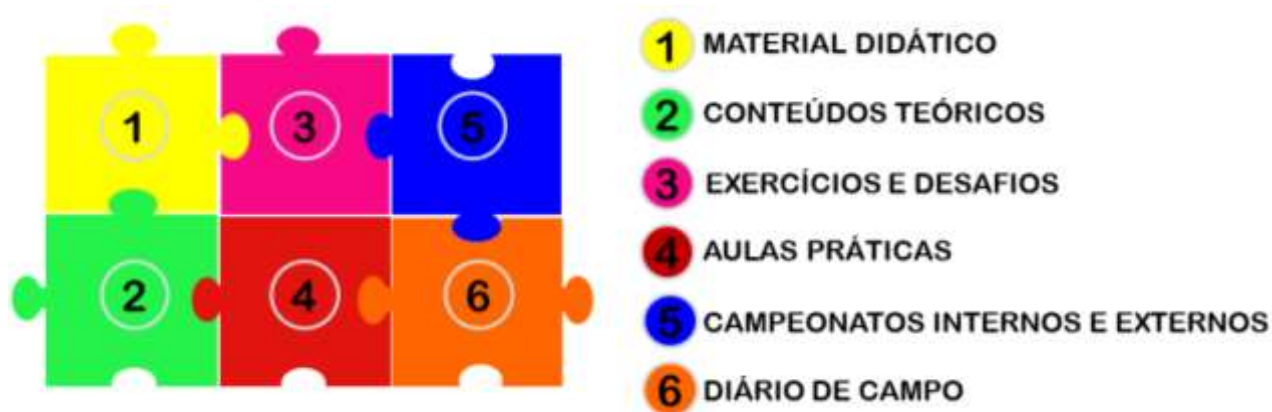
Figura 1: Principais etapas de execução do curso de xadrez.

De modo geral, o curso de xadrez foi estruturado em seis etapas principais, que são exibidas na Figura 1: