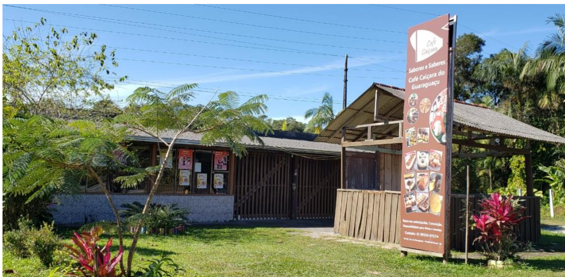
Figura 03 – Café Caiçara, barraquinha original e espaço atual aos fundos