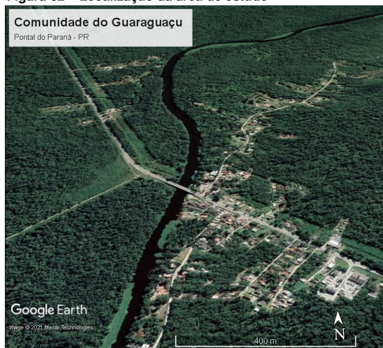
Figura 02 – Localização da área de estudo

Com cerca de 150 anos de existência, a comunidade está localizada no município de Pontal do Paraná, limite com o município de Paranaguá-PR, km 14 da Rodovia Argus Tha Heyn (PR 407), separados pelo rio Guaraguaçu, origem do nome da comunidade.