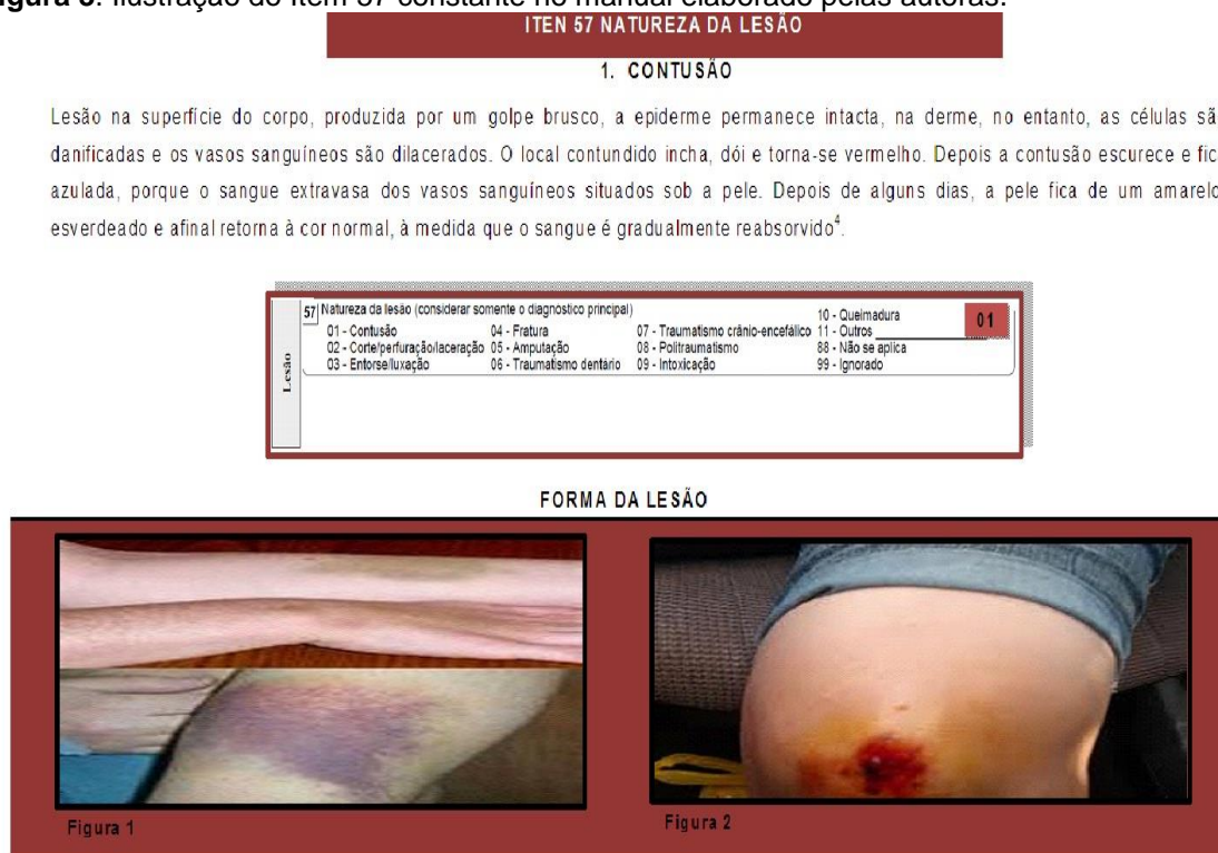
Figura 3. Ilustração do Item 57 constante no manual elaborado pelas autoras.