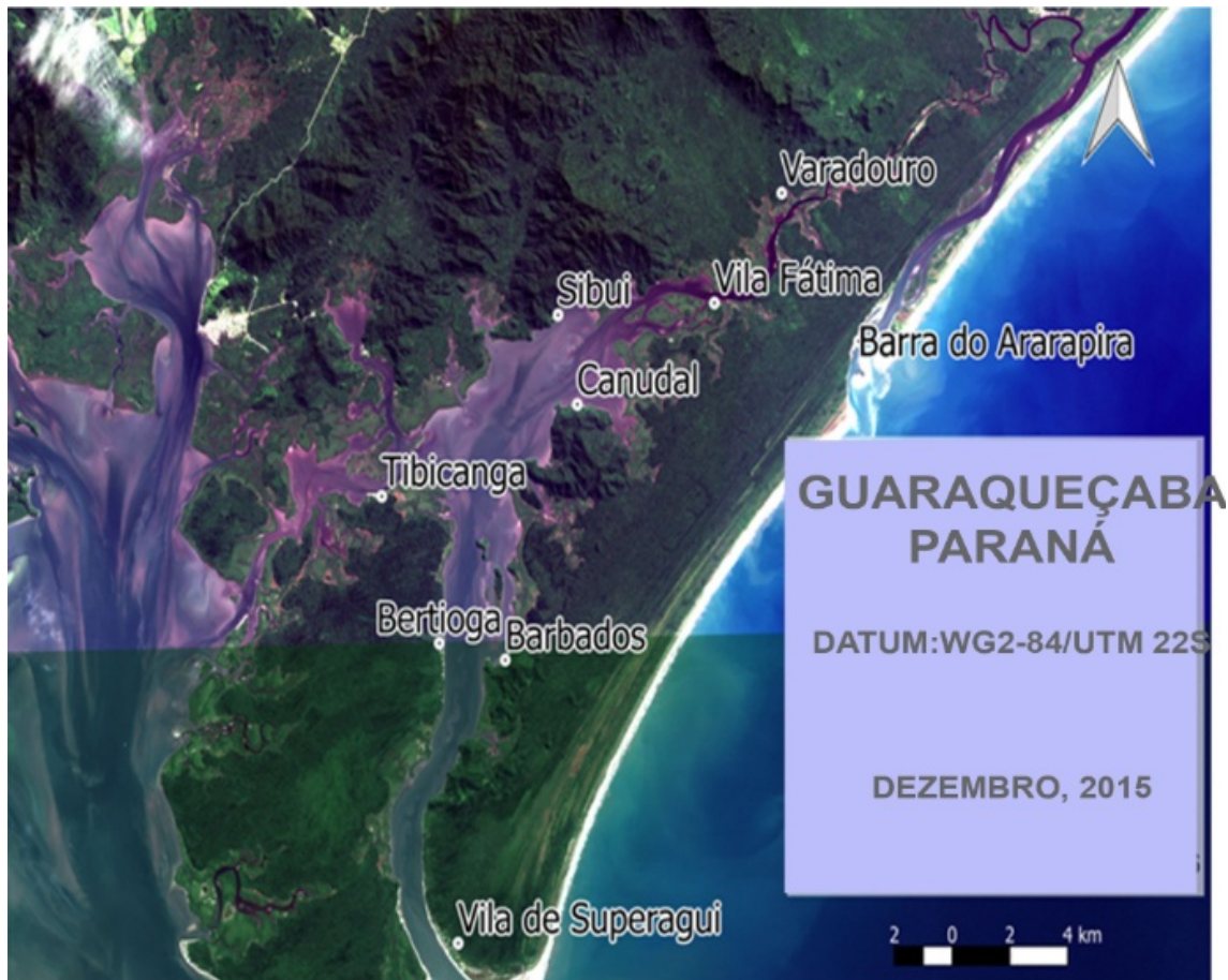
MAPA 1 – Comunidades tradicionais de pescadores e pescadoras artesanais e caiçaras organizadas no MOPEAR.

Pescadores e Pescadoras Artesanais do Litoral do Paraná (MOPEAR), conforme (MAPA 1).