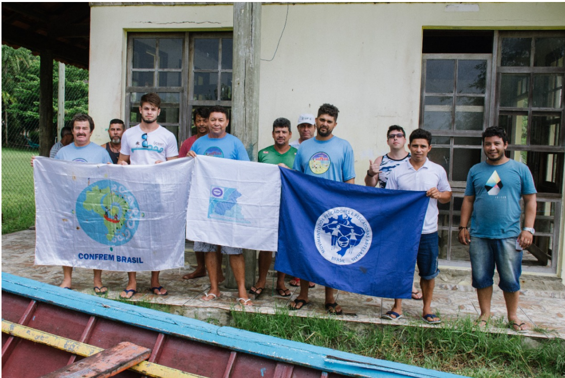
FIGURA 1 – reunião realizada dia 28 de fevereiro de 2020 na comunidade de Barbados.