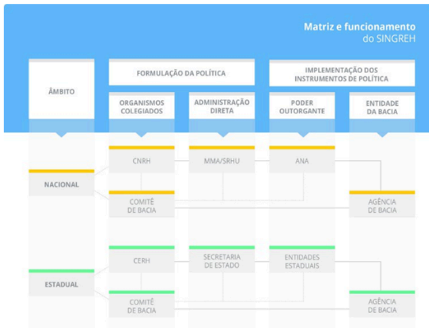
Figura 2 – Organograma: matriz e funcionamento do SINGREH