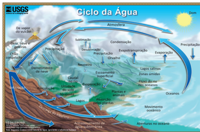
Figura 1 - Ciclo Hidrológico