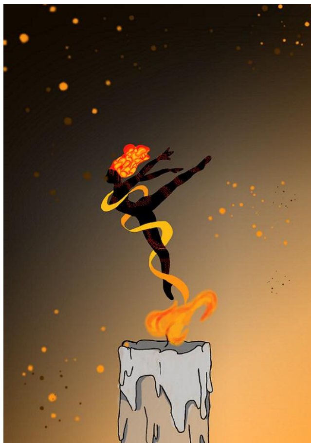
Figura 7- Ilustração de poesia classificada em 3º lugar.

A ilustração de poesia classificada em 3º lugar, com 192 likes , é de Maria Souza, participante da comunidade externa ao IFPR, e foi baseada na poesia Resiliência (Figura 7):