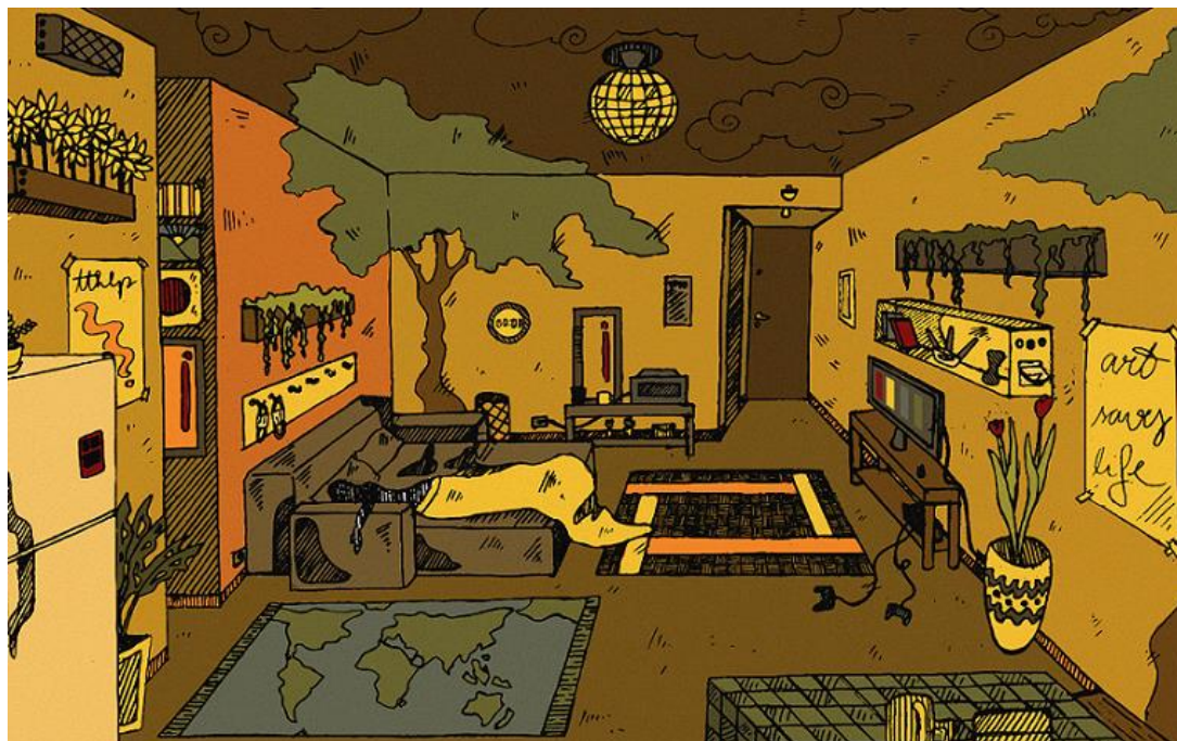
Figura 8 - Ilustração de poesia classificada em 4º lugar.

A ilustração de poesia classificada em 4º lugar, com 121 likes , é de Pablo dos Santos, participante da comunidade externa ao IFPR, e foi baseada na poesia Isolamento (Figura 8):