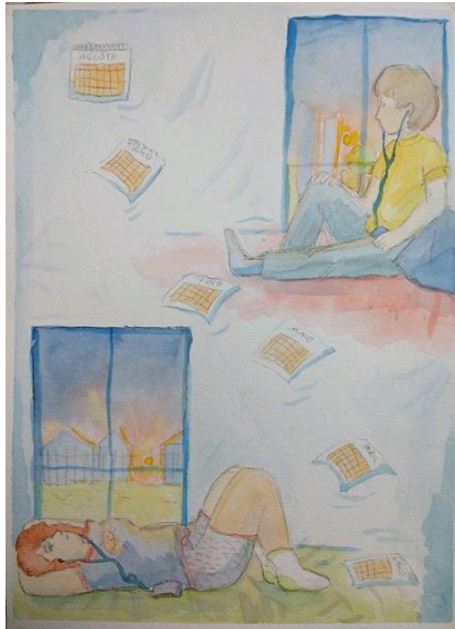
Figura 9 - Ilustração de poesia classificada em 5º lugar.