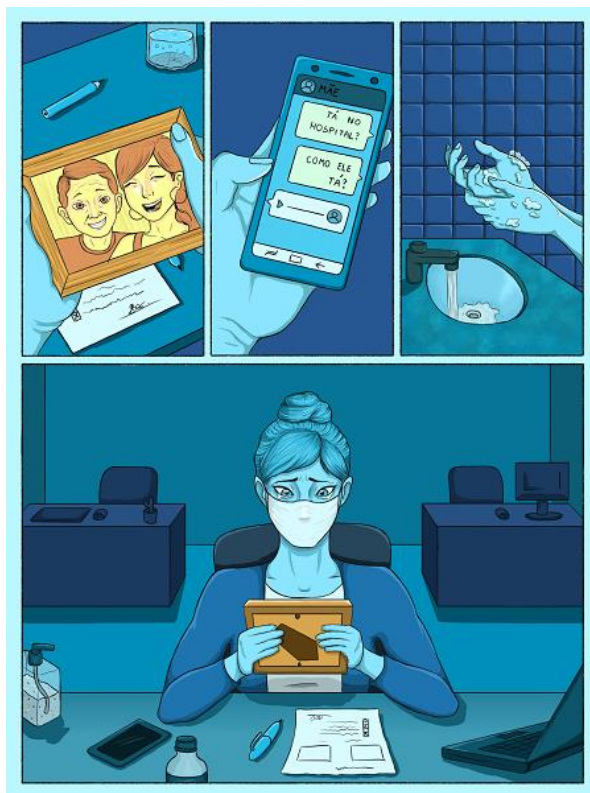
Figura 5 - Ilustração de poesia classificada em 1º lugar.

A ilustração de poesia classificada em 1º lugar, com 348 likes , é de Sandra França, egressa do curso técnico integrado em Jogos Digitais do IFPR Campus Curitiba, e foi baseada na poesia A máscara (Figura 5):