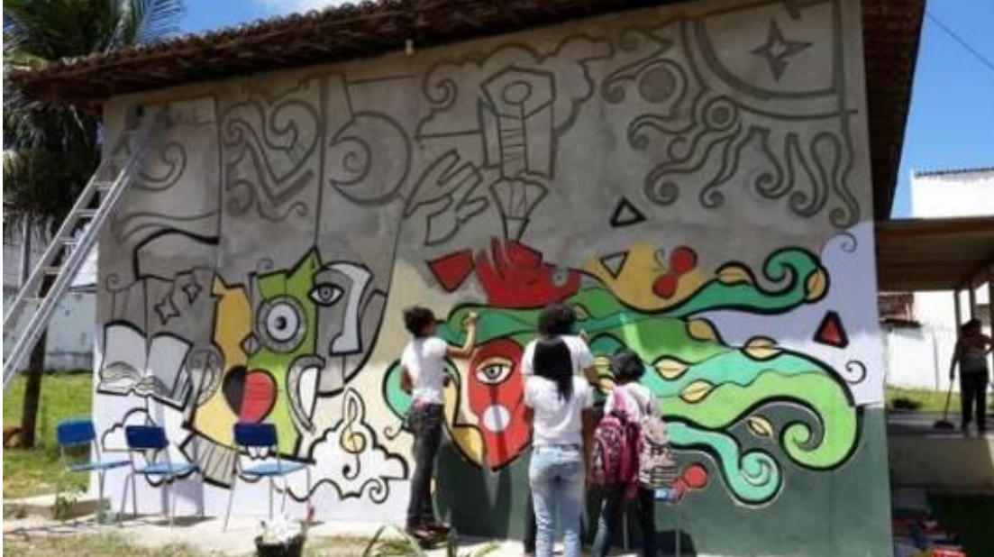
Figura 1 - Mural No Balanço da Arte. Colaborativo sob orientação de Marcos Andruchak.

1) e seu projeto de extensão para criação e produção de murais coletivos em diversos locais e comunidades de Natal-RN.