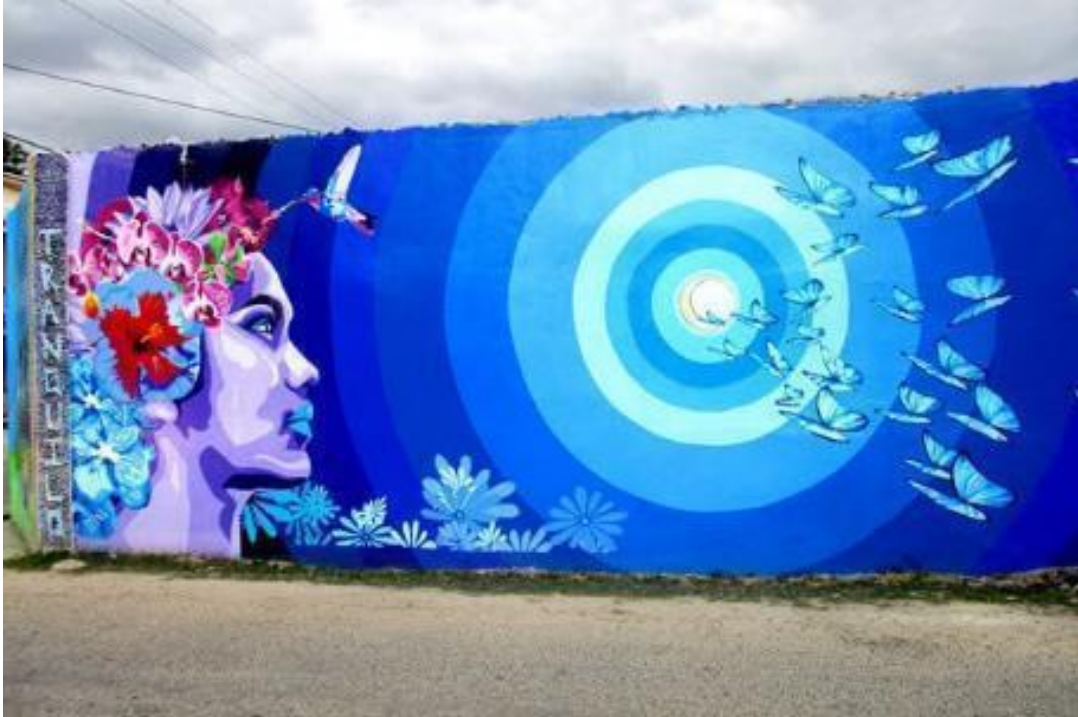
Figura 3 - Mural “A Painted Conversation”. Participativo sob orientação de Natalia Pilato. San Ignacio, Belize.

marcadas por um número que corresponde a uma determinada cor ou tonalidade).