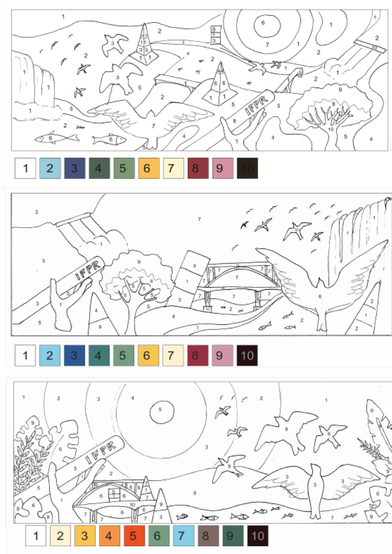
Figura 8 - Guias “pinte por número” para os possíveis desenhos.

quadriculado), e as diferentes áreas de cor são marcadas por números que indicam as cores a serem utilizadas (Figura 8).