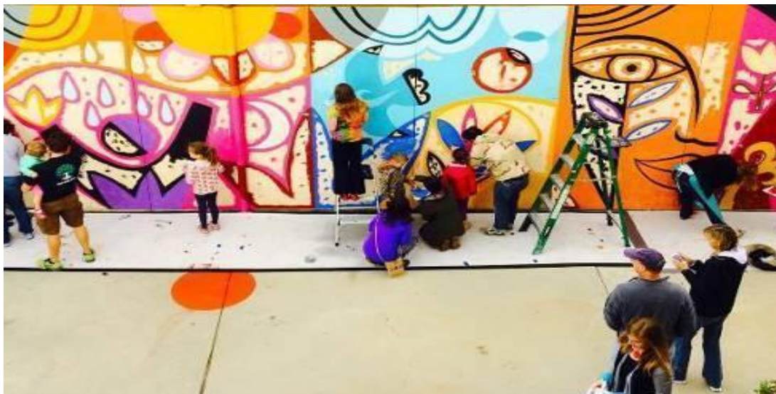
Figura 2 - Mural participativo de Rafael Lopez.

as pessoas envolvendo-as num projeto artístico para embelezar e deixar o bairro mais agradável. O desenho foi criação do artista que, para orientar a pintura, preparou o muro com os espaços de cores pré-contornados, para então serem preenchidos com as cores correspondentes pelos participantes envolvidos. As cores planas, sem passagens gradativas de claro-escuro, facilitaram o feito da pintura, que pôde ser realizada coletivamente sem impedimentos técnicos (RAFAEL LOPEZ, S/D).