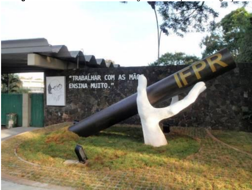
Figura 4 - Monumento Mão de Saramago. IFPR Campus Foz do Iguaçu.

3