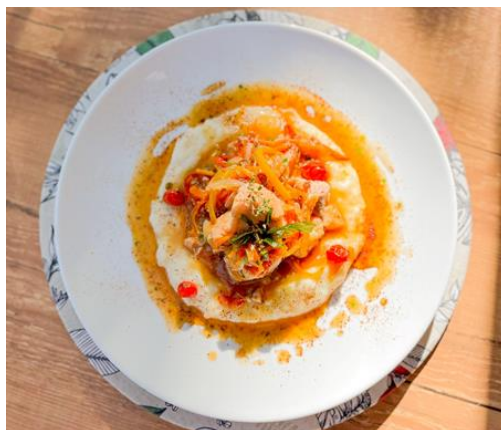
Figura 02. Pirá de Foz no Restaurante Allegro (Hotel Vivaz)

O Restaurante Allegro do Hotel Vivaz serve o Pirá de Foz com purê de batatas, peixe surubim, molho de gengibre, pimentões coloridos e arroz com espinafre também servido à parte, assinado pelo chef de cozinha Júlio de Lima. O valor de venda é R$77,00 (setenta e sete reais). O prato está no cardápio fixo, mas é ofertado em dias alternados conforme a demanda do hotel. O que se verificou também é que o Restaurante Allegro é um estabelecimento destinado aos hóspedes do Hotel Vivaz e que raramente abre seu serviço para moradores locais e quando aberto à comunidade iguaçuense o cardápio ofertado é previamente estabelecido pelo chef, podendo conter o Pirá de Foz como prato ou não, inviabilizando mais a possibilidade de consumir o prato por parte da comunidade de Foz do Iguaçu.