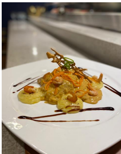
Figura 01. Pirá de Foz no Restaurante Trapiche

O restaurante Trapiche traz a sua versão com peixe surubim, molho cremoso de camarões, purê de batatas e arroz com espinafre (servido à parte) e custa R$122,00 (cento e vinte e dois reais). O prato serve duas pessoas, segundo o chef de cozinha do restaurante, William Diego de Oliveira. Frisa-se que neste estabelecimento o prato foi incluído no cardápio há poucos meses, demonstrando assim a escassez da oferta do produto na cidade de Foz do Iguaçu.