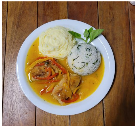
Figura 03. Pirá de Foz no Restaurante Delícias do Rio