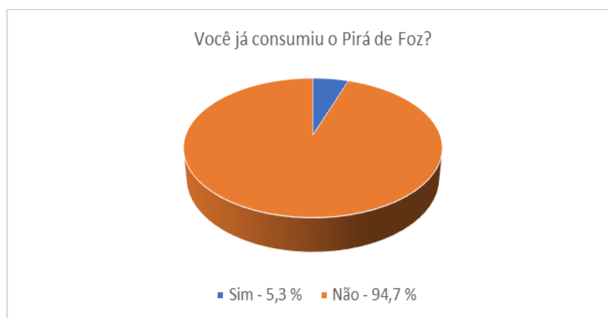
Gráfico 02. Consumo do Pirá de Foz

Portanto, 68,5% dos respondentes afirmam que não ouviram falar do Pirá de Foz, o que demonstra uma popularidade muito baixa e questionável. Quantificando as respostas habilitadas tivemos 352 respostas negativas, contra 153 positivas. A próxima pergunta versava sobre o consumo do prato.